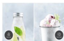
Power Cool / Power Freeze Szybkie chłodzenie i zamrażanie