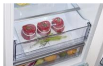
Szuflada Optimal Fresh Zone Szuflada o obniżonej temperaturze