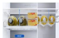
Wielofunkcyjna półka na wino Jeszcze więcej elastyczności przechowywania