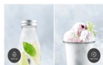
Power Cool / Power Freeze Szybkie chłodzenie i zamrażanie