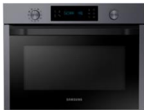
Kuchenka mikrofalowa do zabudowy Czekamy ☺