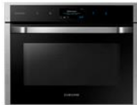
Piekarnik kompaktowy NQ50J9930BS