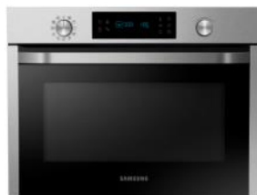
Piekarnik kompaktowy NQ50J3530BS