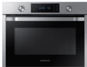
Kuchenka mikrofalowa do zabudowy NQ50K3130BS