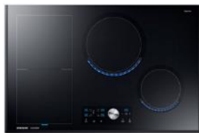
Płyta indukcyjna NZ84J9770EK