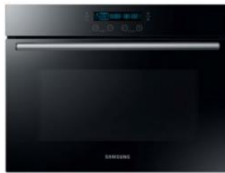
Kuchenka mikrofalowa do zabudowy Czekamy 😊