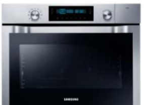
Piekarnik parowy kompaktowy NQ50C7935ES