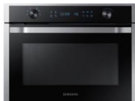
Kuchenka mikrofalowa do zabudowy NQ50J5130BS