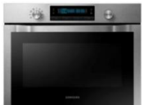
Piekarnik kompaktowy NQ50H5533KS