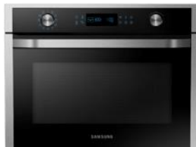
Piekarnik kompaktowy NQ50J5530BS