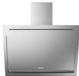
Okap przyścienny NK86NOV9MSR