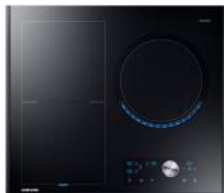
Płyta indukcyjna NZ63J9770EK