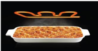
Przycisk grill +30 zwiększa czas podgrzania potrawy