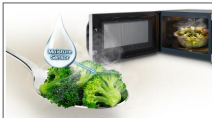
Funkcja Sensor Cook