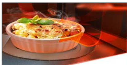
Funkcja podtrzymywania ciepła