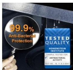
Wnętrze pokryte emalią ceramiczną